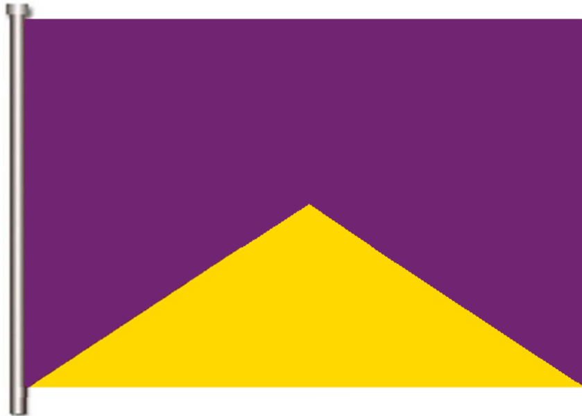
Imagen n° 3

Colores.- Púrpura, la parte superior. Amarillo-gualdo, la inferior. (Imagen n° 3).