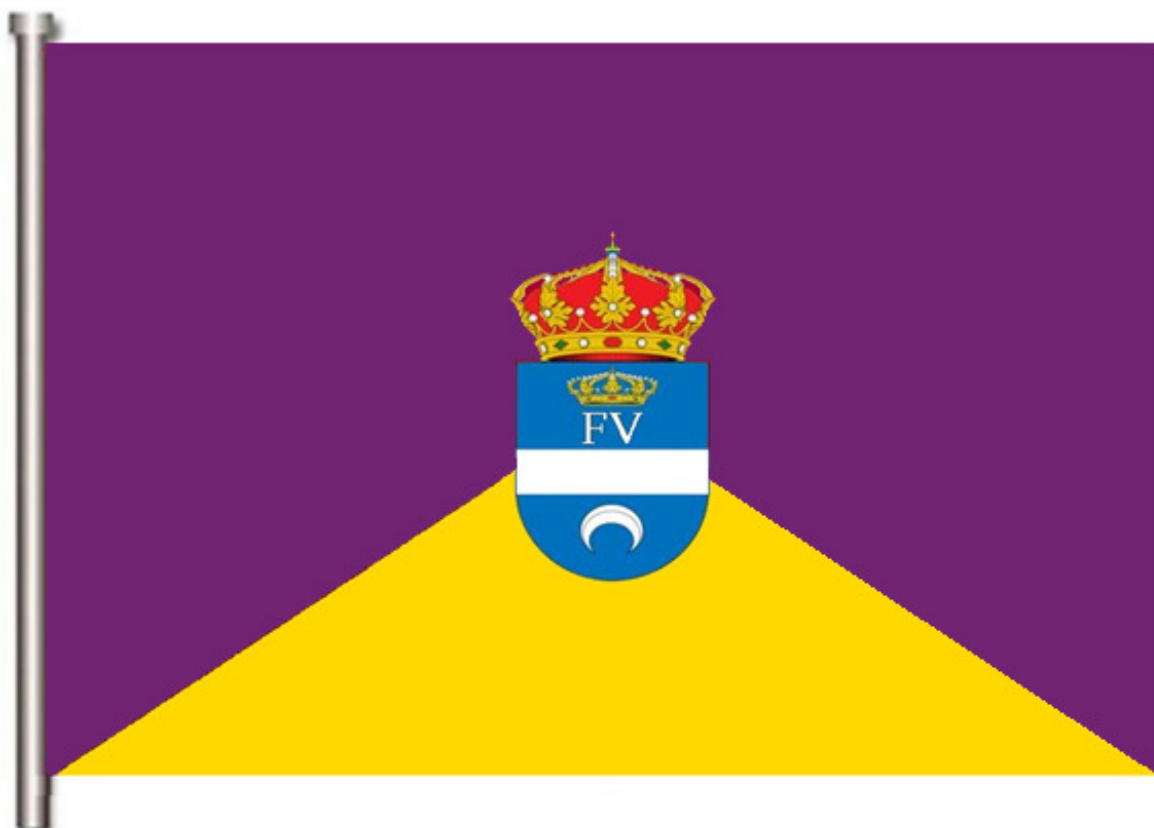
Imagen nº 4