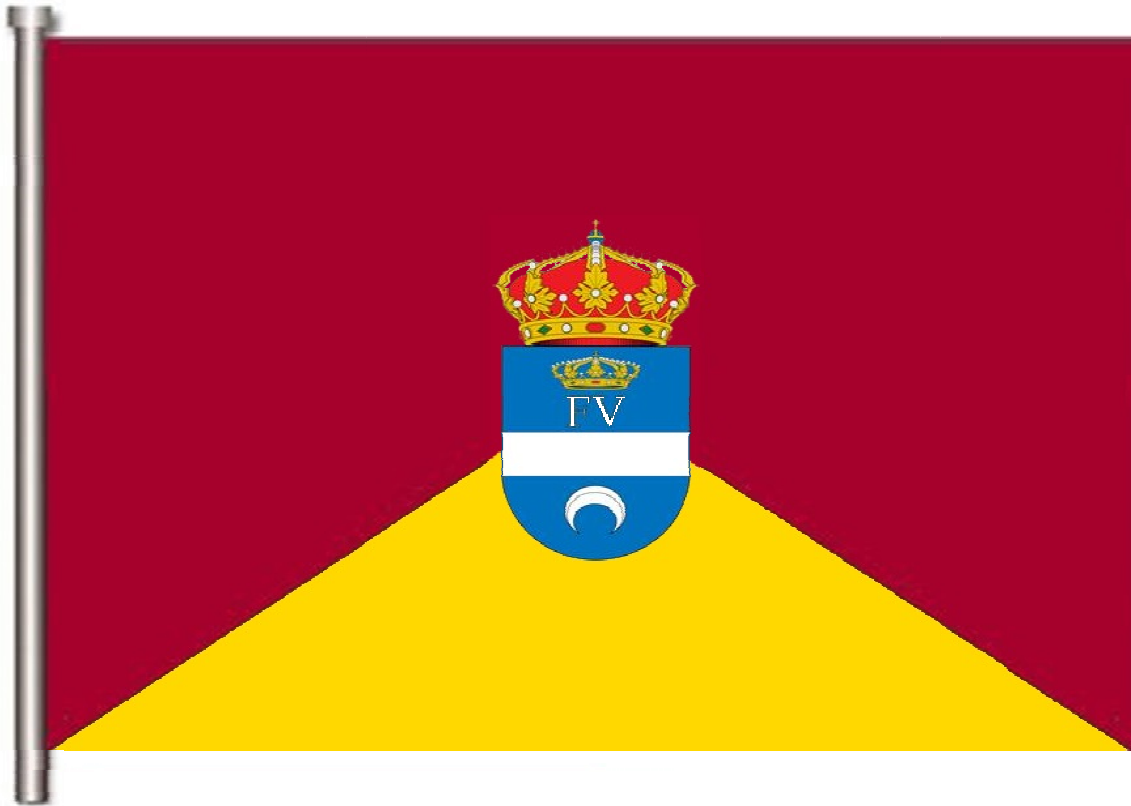
Imagen nº 4